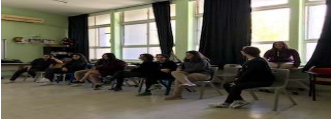
Görsel 8: Forum tiyatrodaki seyirci.

bir çocuğun karar verememesi oynanmaktadır. Probleme çözüm üreten öğrencilerden “seçeneğimiz olmadığında her şeyi yapmak istiyoruz ama seçeneğimiz çok olunca da karar vermekten kaçınıyoruz” gibi bir söylemde bulundular. Kişinin kendini tanımayı ve karar vermeden önce düşünmeleri gerektiği hakkında konuşuldu. Değerlendirme yaparken ne istediklerini bilmeleri için önce kendi kişilikleri, düşünceleri hakkında farkında olmaları sonucuna varılmıştır.