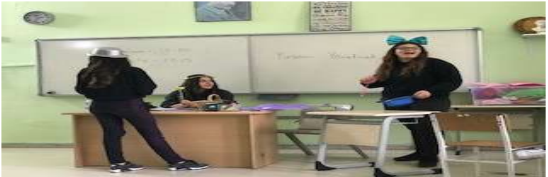
Görsel 2: Forum tiyatrodaki müdahaleler.

Bu haftadaki etkinlik konusu olarak “Çıtır Çıtır Felsefe Doğa ve Kirlilik” kitabından “Berbat olmuş bir tatil” hikayesine yer verilmiştir. Isınma etkinliğinden sonra katılımcılardan gönüllü olarak seyirci veya oyuncu olmaları istenir. Gönüllü öğrenciler canlandırmayı yaparken seyirciler seyrederek olayı anlamaya çalışırlar. Oyun canlandırıldıktan sonra joker sahneye gelir ve seyircilere var olan sorunu sorar. Öğrencilerden “vazgeçsinler gitmesinler, neden bu kadar sorun edildi, farklı bir bölgeye gitsinler, biletlerini iptal etsinler” gibi çözümler gelir. Bu da onları çözüm üretmek için düşünmeye yöneltmiştir. Oyun tekrar oynandığında oyunu durdurup tepkiler vermeye başlarlar. Oyuna müdahale ederken birbirlerini dinlemezler, hep bir ağızdan konuşurlar ve birbirlerini bastırmaya çalışırlar. Değerlendirme aşamasında en çok nerede zorlandınız sorusuna genel olarak kendilerini ifade edemediklerini ve arkadaşlarını dinlemediklerini dile getirirler. Problemin farkında olmalarına rağmen bunu pratiğe dönüştüremediler.