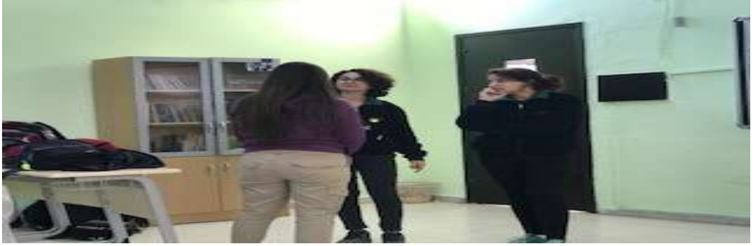
Görsel 9: Doğaçlama aşaması.