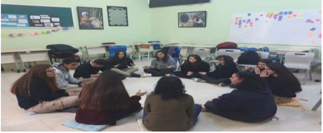
Görsel 5: Değerlendirme aşaması.