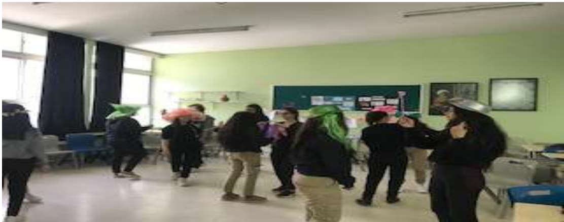
Görsel 3: Yaratıcı dramda ısınma çalışması.

Etkinlikte “Çıtır Çıtır Felsefe İyi ve Kötü” kitabından “İyi ve kötü sözlüğü” hikayesi canlandırılmıştır. Bu sözlük insanlara ne yapıp neler yapmaması gerektiğini söylemektedir. Hikayedeki insanlar hayatlarını bu sözlüğe göre yaşamaktadırlar. Değerlendirme kısmında çoğu öğrenci bu durumun gerçek olduğunu söylediler. Kalıplara göre yaşadıklarını dile getirdiler. Kızlar aileleri tarafından baskı dışarı çıkma konusunda gördüklerini özellikle erkek kardeşi olan kızlar erkeklerin istediği gibi çıktığını ama onların buna hakkı olmadığını dile getirdiler. Kitaptaki gibi ailelerinin de sözlüğünün olduğunu düşünüyorlar ve orada “kız çocuk varsa dışarı çıkamaz ama erkek çocuk varsa çıkabilir” yazdığı için dışarı çıkamıyoruz. Erkeklerde aileleri ile ilgili konular üzerinde durdular. Aileleri ile olan iletişimsizliğin onları rahatsız ettiklerinden bahsettiler. Bu etkinlikte genel olarak aileleri ile ilgili yaşadıkları problem durumlarından söz ettiler. İyi ve kötü kavramı tartışıldı ve konuşmalar sonunda önce kendilerini sevmeleri gerektiğini dile getirdiler. Bu haftada önceki haftalarda olduğu gibi kendilerini ifade etme konusu hakkında zorluk yaşadılar ancak konu hakkında düşünmeye başladılar.