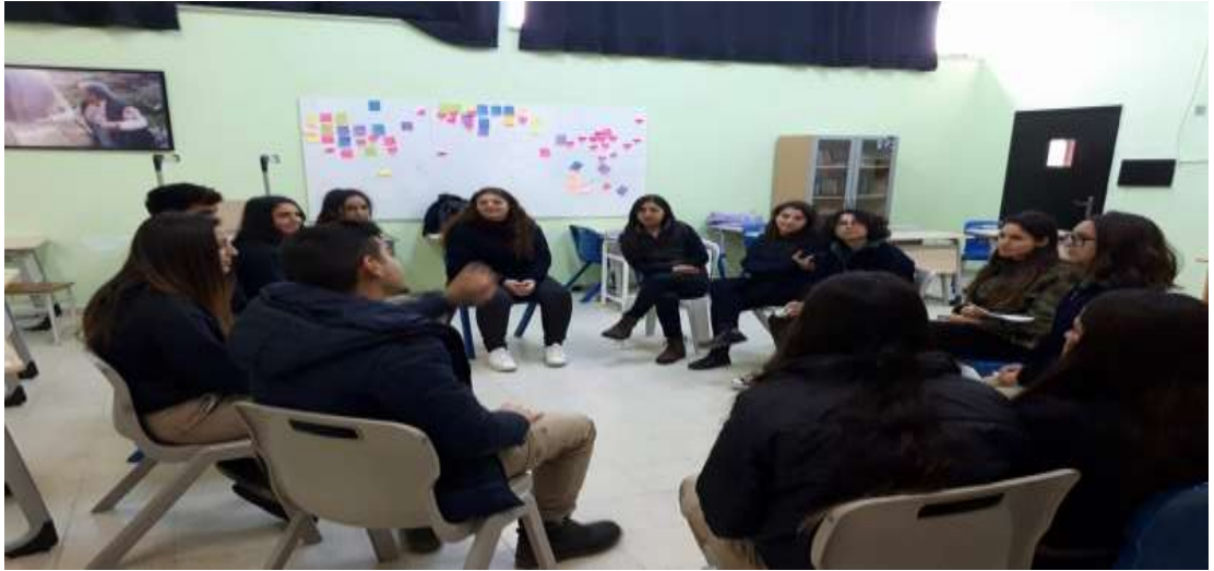
Görsel 7: Değerlendirme aşaması

“Çıtır Çıtır Felsefe İş ve Para” kitabından “Kimsenin çalışmadığı bir dünya” hikayesi canlandırılır. Bu haftaki etkinliği öğrencilerin isteği doğrultusunda okulun bahçesinde yapılır. Isınma etkinliğinde tek sıra olunur. Baştaki öğrenci nasıl yürürse arkasındakilerde aynı şekilde yürümeye başlar. Bir süre sonra baştaki öğrenci yürüyüşünü değiştirir. Böylece etkinlik daha da eğlenceli hale gelmiş olur. Öğrencilerin bu etkinliğini gözlemledikten sonra artık dışarıyı düşünmediklerini, o ana odaklandıklarını gözlemledim. Forum kısmına geçildiğinde hikayede geçen peri herkese yiyecek, içecek, kıyafet kısacası herkesin dilediği şeyleri kapının önüne bırakır. Ancak bir gün peri ortadan kaybolur. Bu probleme kendilerinin gruplar oluşturup çeşitli çözümler ürettikleri gözlemlenmektedir. Hikayenin içine ülkeleri de karıştırarak yaratıcı doğaçlamalar yapmışlardır. Değerlendirme aşamasında ise en çok doğaçlama yapmaktan hoşlandıklarını ve etkinlik süreci ile ilgili herhangi bir olumsuz düşüncelerinin olmadığını dile getirdiler.