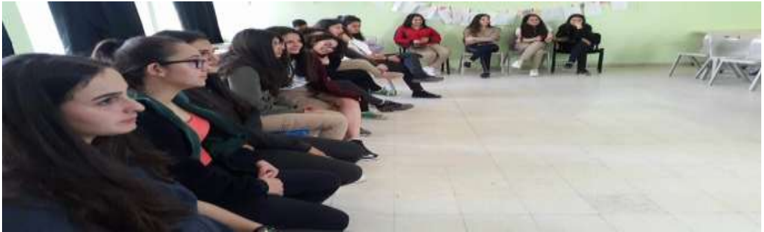
Görsel 4: Forum tiyatrodaki seyirci.

hazırladıkları hem de eğlendikleri gözlemlenmektedir. Ön oyun başlamadan önce araştırmacı renkli şapkalar, çeşitli kanatlar, gözlükler ve taçlar gibi materyaller getirir. Öğrenciler materyalleri görünce etkinliğe olan heyecan ve isteklerinde artış gözlemlenir. Ön oyuna gönüllü istenildiği zaman neredeyse sınıfın tamamı katılmak ister. Oyunu canlandırırken yaptıkları doğaçlamalar ile yaratıcılıklarının geliştiği görülmektedir. Müdahalelerde probleme sadece söylem olarak katılmak yerine oyunu durdurup oyuna girmeye başladılar. Çözüm üretirken fikir ve düşüncelerini rahatlıkla dile getirdiler. Değerlendirme aşamasında ise canlandırmayı yapmaktan keyif aldıklarını materyallerin onlara güven verdiğini söylediler. Haksızlığa dur demeleri, fikirlerinin dinlenmesi ve değerlendirilmesi en çok beğendikleri nokta olduğunu dile getirdiler. Süreci anlamak için seyircilerin probleme çözüm üretebilmeleri için iyi bir izleyici olması gerektiğini ve birbirlerini dinlemeleri gerektiğini dile getirdiler.