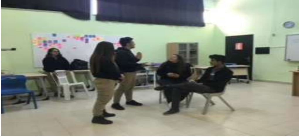
Görsel 1: Forum tiyatrodaki ön oyun.