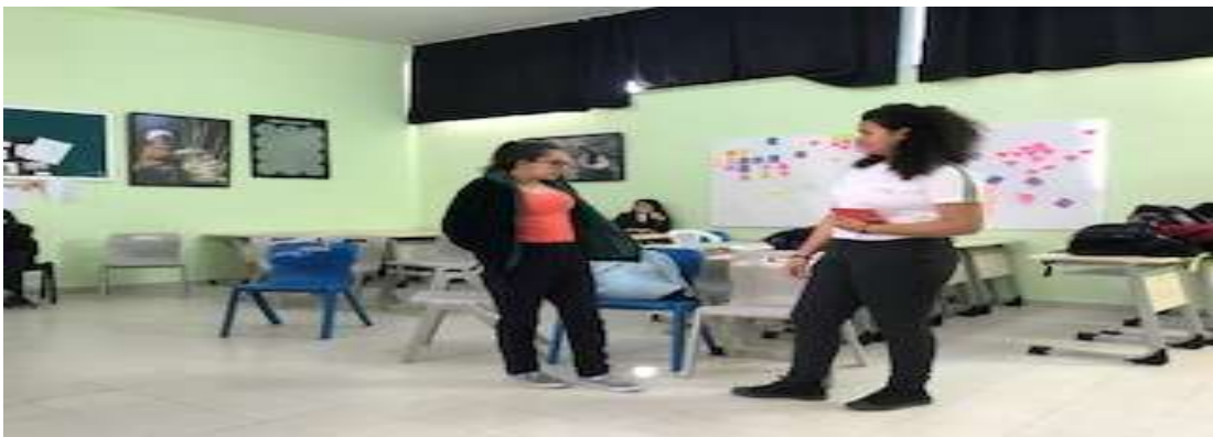
Görsel 10: Forum tiyatrodaki müdahale aşaması.

“Çıtır Çıtır Felsefe Gerçekten ve Yalancılıktan” kitabından “Yalan söylemek bazen pratik olabilir” hikayesi canlandırılır. Etkinliğimizin son gününde öğrenciler üzgündü. Etkinliklere devam etmek istediklerini dile getirdikten sonra ısınma etkinliğine geçilmiştir. Araltırmacı tarafından getirilen çeşitli materyaller (şapka, gözlük, tüy) kullanılarak ön oyun başlamıştır. Bu hikayede sevgilisini arkadaşları ile tanıştıran kız arkadaşlarının fikirlerini almak ister. Arkadaşları oğlanı sevmiyor ve bunu dile getirip getirmem arasında gidip geliyorlar. Sonuç olarak arkadaşına doğruyu mu yalanı mı söylemesi gerektiğine bit türlü karar veremiyor. Bu duruma müdahalelerde öğrencilerin çözümleri arkadaşlarını düşüncesi ne olursa olsun doğru ve dürüst bir şekilde dile getirmesi gerektiği gibi çözümler üretiliyor. Değerlendirme sonunda araştırmacıya öğrencileri tarafından çiçek veriliyor. Son değerlendirme aşamasında öğrenciler düşünme, karşısındakine değer vermesi gerektiğini, dinlemesi gerektiğini ve empati kurabilme gibi beceriler kazandıklarını dile getiriyorlar.