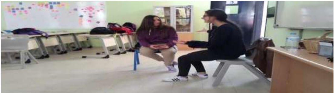
Görsel 6: Forum tiyatrodaki problem çözme aşaması.

“Çıtır Çıtır Felsefe Savaş ve Barış” kitabından “Her şeyi yöneten güç olduğunda” hikayesi canlandırılır. Isınma etkinliğine çember olarak elleri ve kolları yediye kadar sayarak başlanır. Daha sonra “zip, zap, zop” oyununa geçilir. Ön oyun için gönüllü istenildiği zaman artık öğrenciler rahatlıkla öne çıkarlar. Çıkacak olan oyunun ne olacağını merakla bekleyen seyirciler ise çözüm üretmek için hazırdırlar. Lise öğrencilerine başlarda sesi duyurmakta zorlanırken bu durum yavaşça ortadan kalkmaya başlamıştır. Güçlü olanın kazandığı ön oyun tekrar oynanmaya başlanırken seyirciler müdahalelerde bulunurken ortak paylaşım üretmek adına eşit çözümlerde yani her iki tarafında kazanacağı çözümler üretmişlerdir. Değerlendirme aşamasına geçildiğinde güçlü devletler, fiziksel ve maddi güçler hakkında düşüncelerini dile getirdiler.