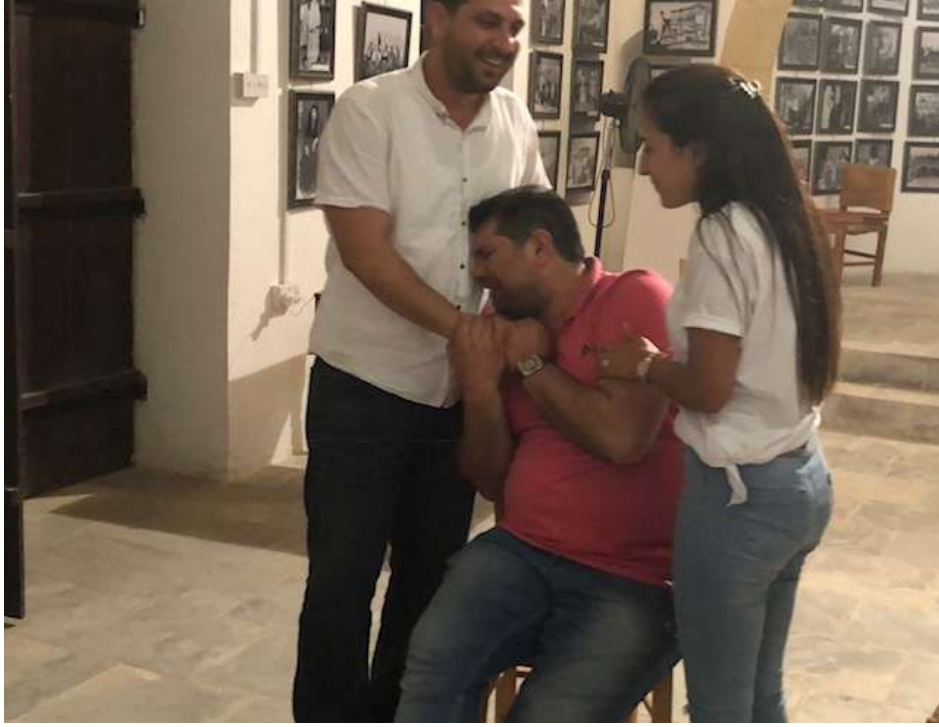
Ek.VII. Katılımcılar3. Çocuk Yetiştirmede Olumlu Disiplin Yöntemi Etkinliğine Olumsuz Disiplin Fotoğrafları Gibi Fotoğraf oluştururlarken