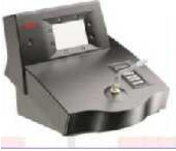
Alkol zleme Cihazı

Bu yöntem, Danimarka, Avusturya, Hollanda, sviçre, sveç ve Norveç'te uygulanmaktadır. 319