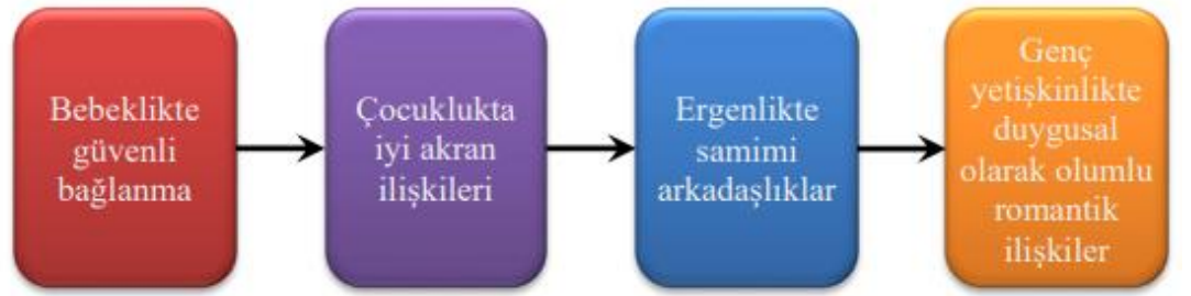
Şekil 1. Romantik İlişkinin Oluşma Evreleri

Gençlik dönemlerinde Erikson'un ifade ettiği yakınlık karşısında yalıtılmışlık, gelişmenin analiz edilebilmesi için eş edinmek, bağlanmak ve romantik bir ilişki yaşamak pekâlâ önem taşımaktadır. Romantik ilişkiye girmenin temeli ergenlik(puberta) dönemlerine atılmaya başlar ve yetişkinliğe doğru gidildikçe artış göstermektedir. Ergenlik dönemlerinde geliştirilen arkadaşlık ilişkisi romantik olarak yakınlaşmaların doğmasına olanak tanımaktadır. Ayrıca romantik birlikteliklerinin oluşması ve sağlıklı devam edebilmesinin köklerinin erken dönemde (0-2 yaş) başlamakta olduğu da ifade edilmektedir (Sigelman ve Rider, 2017).