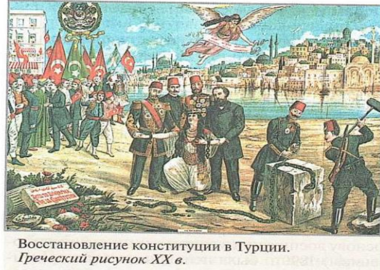
Görsel 8. Türkiye’de anayasanın restorasyonu. Yunan resmi XX. yy (Morozov vd., 2021;198).

Kısa bilgi aktarımından sonra kitaba ‘ Türkiye’de anayasanın restorasyonu ’ diye görsel eklenmiştir. ‘Yunan resmi XX. yy’ diye bilgi verilmiştir. Görselin altında ‘ Bu olay neden böyle bir isim aldı ve ne zaman oldu? ’ diye soru yönlendirilmiştir (Morozov vd., 2021; 198). Yine kitabın V. ünitesinde yer alan ‘ Uluslararası çatışmalar: dünya savaşına giden yol ’ denen konu içinde Balkan savaşlarına değinilmiştir (Morozov vd., 2021; 206). Trablusgarp savaşı ile meşgul olan Osmanlı Devletine 1912’de Rusya’nın destek vermesi ile Bulgaristan, Yunanistan, Sırbistan ve Karadağ savaş açmıştır. I. Balkan savaşında Osmanlı ordusu bozguna uğratılmış ve toprak kaybetmiştir. Savaş sonrası Balkan devletleri Osmanlıdan aldıkları toprakları kendi aralarında paylaşmamış ve Bulgaristan toprak paylaşımında haksızlığa uğradığı için Yunanistan ile Sırbistan’a saldırmıştır. Böylece II. Balkan savaşı başlamıştır. Ancak Bulgaristan yenilmiştir. Osmanlı kaybeden topraklarını geri almak için savaşa girmiş ve Bulgaristan’a saldırmıştır. Bulgaristan barış isteğinde bulununca 1913’de İstanbul Antlaşması imzalanmıştır (Oral, 2011). Balkan savaşları Rusya Devletinin 9. sınıf tarih ders kitabında şu paragraf ile açıklanmıştır: