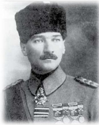
Görsel 9. M. Kemal. Fotoğrafi (Şubin, 2019; 41).

kurdu, demokratik ve komünist örgütleri yendi ve reformlara başladı. Türkiye Cumhuriyeti ilan edilerek, Müslüman din adamlarının (vakıfların) toprakları laikleştirildi. İslami hukuk normları, Arap alfabesi ve hatta geleneksel kıyafetler zorla Avrupa kıyafetleriyle değiştirildi. Ekonomide bir devletçilik politikası yürütüldü, ancak özel ticaret kaldı. Yetkililer çok eşliliği yasakladı, kadınlara oy hakkı verildi, laik bir eğitim sistemine geçildi. Modern Türk Devletinin temelleri bu şekilde atıldı' (Şubin, 2019; 40-41).