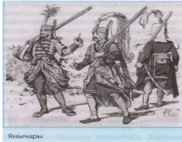
Görsel 4. Yeniçeriler (Yudovskaya vd., 2019; 197).

Görüldüğü üzere Osmanlı devletinin kara kuvvetlerini oluşturan yeniçeri ocağı hakkında bilgi paylaşılmıştır. Müslüman olmayan Hıristiyan çocukların devşirme kanunuyla Müslümanlaştırıldıkları, İslam ve Türk örf adetlerinin öğretilmesi için Müslüman Türk ailelerine verildikleri anlatılmıştır. Eğitim süresi bitip, vakti gelince onların Yeniçeri ocağına alındıkları ifade edilmiştir. Yeniçerilerin görevi, kıyafeti ve silahları hakkında bilgi verilmiştir. Osmanlı'nın Balkanlarda, Orta Avrupa'da ve Orta Doğu'daki fetihlerinde önemli katkıları olduğu dile getirilmiştir. Osmanlı kara kuvvetinin talimli ve mükemmel sayılan yeniçeri ocağı Avrupalıların içine korku saldıkları yazılmıştır. Daha sonra Osmanlı'da gerileme dönemi başlayınca yeniçeri ocağında disiplin bozulması nedeniyle, onların kurallara aykırı hareketlerde buldukları örnek verilmiştir (Yudovskaya vd., 2019; 196-197).