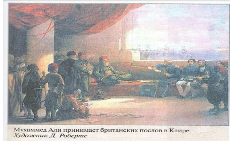
Görsel 6. Muhammed Ali Kahire'de İngiliz elçilerini kabul ediyor. Ressam D. Roberts (Morozov vd., 2021; 35).

Kitapta Mısır valisi Mehmet Ali 'Muhammed Ali' olarak anlatılmıştır. Onun takip ettiği reformlar aktarılmıştır. Osmanlı padişahına isyan ettiği yazılmıştır. Avrupalı güçlerin padişaha yardım etmesiyle isyan bastırıldığı belirtilmiştir. Osmanlı Devletinde merkezi otoritenin zayıf olduğu mesajı verilmiştir. Mehmet Ali isyanına karşı Rusya ile Osmanlı padişahının ittifak halinde olduğu sunulmuştur (Morozov vd., 2021; 35-36).