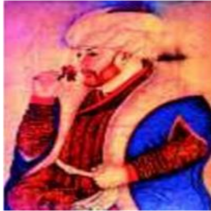
Görsel 3. Sultan II. Mehmet. 15. Yüzyılın Resmi (Agibalova ve Donskoy, 2014; 212).