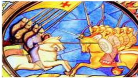
Görsel 2. Haçlı ordusunun Selçuklu Türklerle Çatışması. Fransa'daki Saint-Denis Katedrali'nin Vitray Penceresi (Agibalova & Donskoy, 2014; 136).

bağışlanacağına söz verdi ', diye aktarılmıştır (Agibalova & Donskoy, 2014; 136). Hıristiyan dünyası için Filistin topraklarının kutsal olduğu, bu toprakların Müslüman Selçukluların elinde olduğunu ve Hıristiyanların kutsal toprakları geri almaları gerektiği için haçlı seferlerinin başlandığı dile getirilmiştir (Agibalova & Donskoy, 2014; 136). '11. Yüzyılın ortalarından itibaren Filistin Selçuklu Türklerinin hâkimiyeti altındaydı' denilmesine göre, 11. yüzyıl Hıristiyan dünyasının karşısında Selçuklu gücünün olduğu ve bu seferin Selçuklulara karşı yapılacağı mesajı verilmiştir (Agibalova & Donskoy, 2014; 136). Bunun yanında Haçlı orduları ile Selçuklu ordularının çatışmasını gösteren görsel kullanılmıştır.