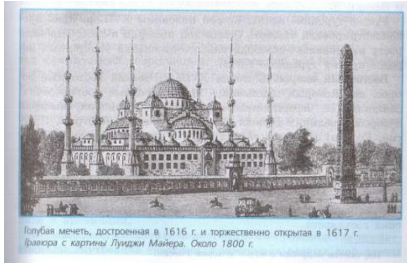
Görsel 5. 1616'da inşa edilen ve 1617'de açılışı yapılan Mavi Cami (Sultanahmet Camisi). 1800'deki Ligi Mayer'in tablosundan gravür (Yudovskaya vd., 2020; 201).

Görselin altına '1616'da inşa edilen ve 1617'de açılışı yapılan Sultanahmet Camisi. 1800'deki Ligi Mayer'in tablosundan gravür' diye not düşülmüştür (Yudovskaya vd., 2020; 201). Lale devri anlatıldıktan sonra ve Sultanahmet camisinin görseli sunulduktan sonra Osmanlı-Rus savaşları hakkında bilgi verilmiştir. Konu şu şekilde aktarılmıştır: