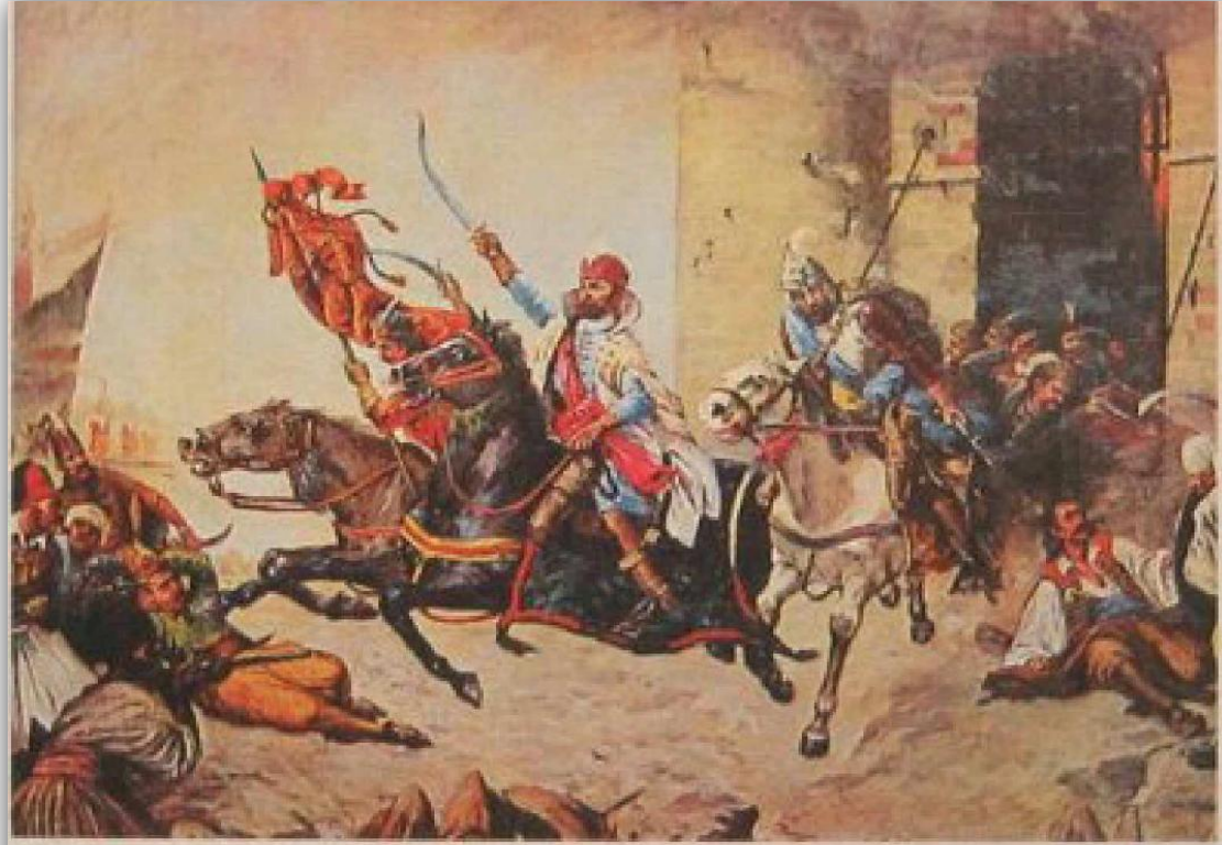
Osmanlı Devleti Gerileme Devri'nde girdiği savaşlarda başarısız olmuştur.