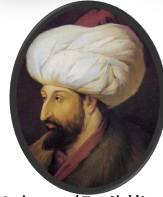
II.Mehmet(Fatih)'in ilk iki yılı