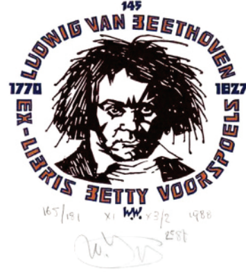
Resim 7: L.V. Beethoven konulu bir ekslibris (Walter Wuyts X1/X3, 1988, 100x100 mm).

İletişimin gerçekleşmesine yardımcı olan kavramlardan birisi de geri beslemedir (feedback). Geri besleme göndericinin etkin bir iletişim kurmasında başvurduğu önemli bir aşamadır. Ancak geri besleme her tür iletişimde aynı etkide değildir. Kitle iletişim araçlarının bazılarında bu durum gerçekleşemez. Örnek olarak bir derslikte verilen ders sırasında, eğitmen ve öğrenci arasındaki iletişimle, uzaktan eğitim araçlarıyla verilen ders sırasında gerçekleşen iletişim arasında geri besleme açısından pek çok farklılık vardır. Derslikte verilen ders sırasında eğitmen öğrencilerden gelen tepkiler (geri besleme) aracılığıyla dersi daha anlaşılır kılabilir. Uzaktan eğitim anında geri besleme çok sınırlıdır. Fakat geri beslemenin olmaması, iletişimin gerçekleşmemesi anlamına gelmez.