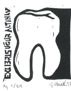
Resim 6: Diş hekimi Uğur Altınay için yapılmış ekslibris (Gökhan Okur X3, 1997, 48x50 mm).

lerdir. Bunlar gerçekte birbirlerine bağlıdır. Örnek olarak Görüntü 6'daki ekslibris, adına yapılan kişinin mesleği ile doğrudan bağlantılıdır. Diş imgesi, Uğur Altınay'ın diş doktoru olduğuna dair belirtisel, bazı yönleriyle nesnesiyle benzerlikler taşıdığı için de görüntüsel göstergedir. Başka bir örnek olarak Görüntü 7'de L.V. Beethoven'in portresi kendisiyle benzerlikler taşıması bakımından görüntüsel, ekslibris sahibinin müzik sevdiğine ya da müzisyenliğine bir gönderme yaptığından dolayı belirtisel bir göstergedir (Görüntü 7).