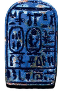
Resim1: M.Ö. 1400 yıllarında açık mavi renk fayans üzerine yapılan ve III. Amenophis'in kitaplığına ait olan ekslibrisin görüntüsü.

Ekslibris , kitabın kime ait olduğunu bildiren, sembol ve işaretlerden oluşan, sanat ve tasarım ilkeleri doğrultusunda sanatsal öğelerin buluştuğu, belirli sayıda, farklı teknikler ile çoğaltılan, kitapların iç kapağına yapıştırılacak kadar küçük boyutlara sahip, daha çok batı ülkelerinde yaygın, geleneksel bir sanatsal çalışmadır. ...'nın kitabı, ...'nın kitaplığına ait veya... 'nın kütüphanesinden anlamına gelen ekslibris İngilizce'de 'bookplate' olarak adlandırılır. Köklü bir geleneğe sahip olan ekslibrisin bilinen en eski örneği (Görüntü 1), M.Ö. 1400 yıllarında yapılmış olan III. Amenophis'in kitaplığına ait açık mavi fayans bir objedir "Lamb, (2012)". Kültür ve sanata verdiği büyük önemle tanınan ve M.Ö. 600 yıllarında yaşamış olan Asur Kralı Asurbanipal zamanından kalma ekslibris örneklerinin bulunduğu da belirtilmektedir "Koşay (1977)". Almanyada 1450 yılında 'kirpici' lakaplı bir papazın adına yapılan çalışma ilginç bir örnektir (Görüntü 2). Ancak M.S. 15. yüzyılın üçüncü çeyreğinde Almanya'da; ağaç üzerine elle boyanmış basit bir arma ile sahibinin eliyle yazılmış bir sözden oluşan ekslibris , gerçek anlamdaki ilk örneklerdir.