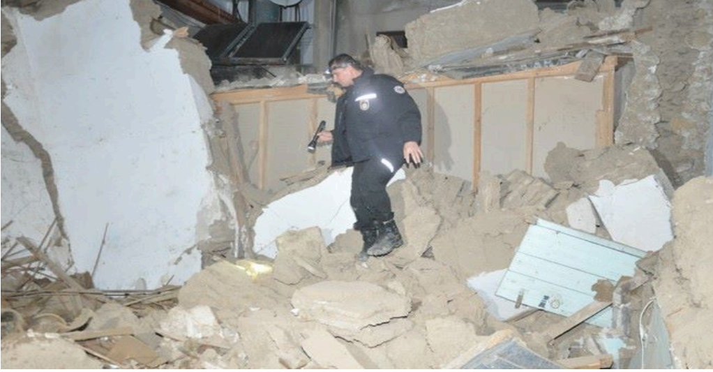
Fotoğraf 5: Surlariçi'nde Çöken Ev (“Surlariçi'nde Ev Çöktü”, 2016).

“Surlariçi bölgesinde geçen hafta içinde yıkılan iki katlı ev, gözlerin bakımsızlıktan harabeye dönen başka evlere ve tarihi binalara çevrilmesine neden oldu... Bölge halkı, her an yıkılacak gibi duran evlerin can ve mal güvenliklerini tehdit ettiğini söylüyor” (“Birçok Bina Çökmek Üzere”, 2017).