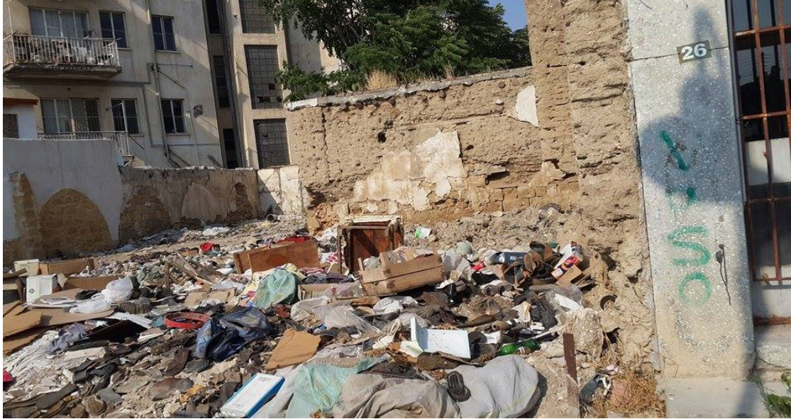
Fotoğraf 7: Surlariçi Bölgesindeki Çevre Kirliliği (Lefkoşa’nın Göbeği, 2015).

“Başkent Lefkoşa’nın tam göbeğinde her gün yüzlerce turisti ağırlayan Surlariçinde çevre kirliliği vatandaşların tepkisine neden oluyor. Arasta’da objektiflere yansıyan bu kareler bir yandan sorumsuz vatandaşların çevreye attığı ve belediye ekipleri tarafından ise kaldırılmayan çöpler ile dikkat çekiyor” (Lefkoşa’nın Göbeği, 2015).