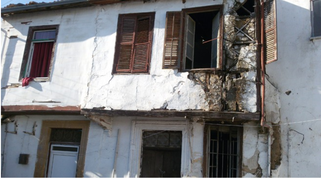
Fotoğraf 6: Surlariçi'nde Yıkılmaya Yüz Tutmuş Ev (“Birçok Bina Çökmek Üzere”, 2017).

“Surlariçi bölgesinde geçen hafta içinde yıkılan iki katlı ev, gözlerin bakımsızlıktan harabeye dönen başka evlere ve tarihi binalara çevrilmesine neden oldu... Bölge halkı, her an yıkılacak gibi duran evlerin can ve mal güvenliklerini tehdit ettiğini söylüyor” (“Birçok Bina Çökmek Üzere”, 2017).